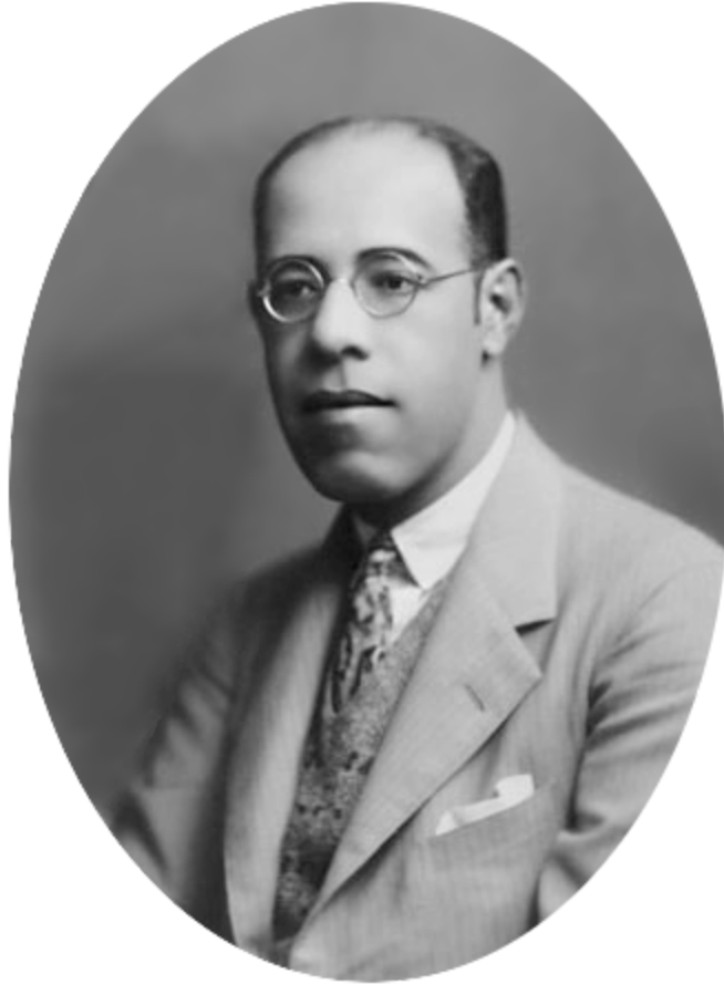
Mário de Andrade

Nome completo: Mário Raul Moraes de Andrade